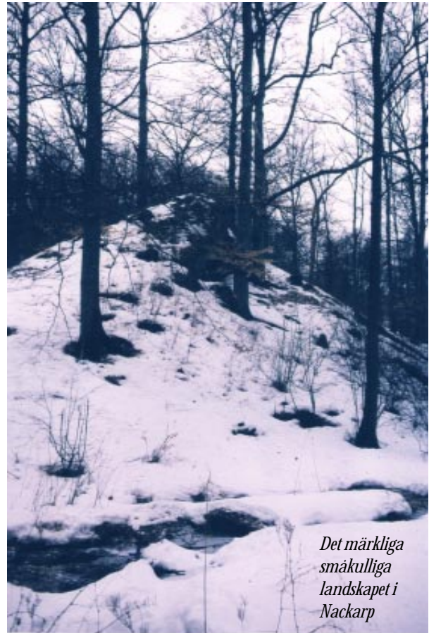
Det märkliga småkulliga landskapet i Nackarp