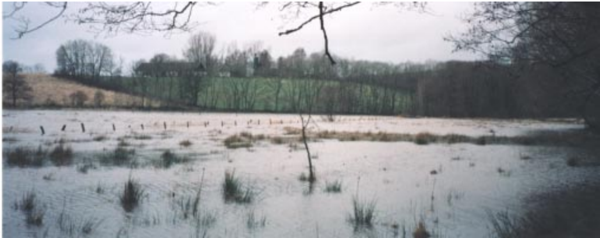
Översvämmade mader vid Hallabäcken

Inom den Europeiska Unionen regleras naturvårdsfrågorna i första hand genom två direktiv, habitatdirektivet och fågeldirektivet. Syftet med dessa är att bevara arter och naturtyper som i ett europeiskt perspektiv betraktas som skyddsvärda i ett sammanhängande europeiskt ekologiskt nätverk av naturområden - Natura 2000. På Söderåsen har, av Regeringen, fem områden anmälts till Natura 2000. Dessa är den blivande nationalparken på Söderåsen, Klövahallar, Traneröds mosse, delar av Hallabäckens dalgång samt Liahusängen. Dessa områden är fr o m 2001-07-01 att betrakta som riksintressen.