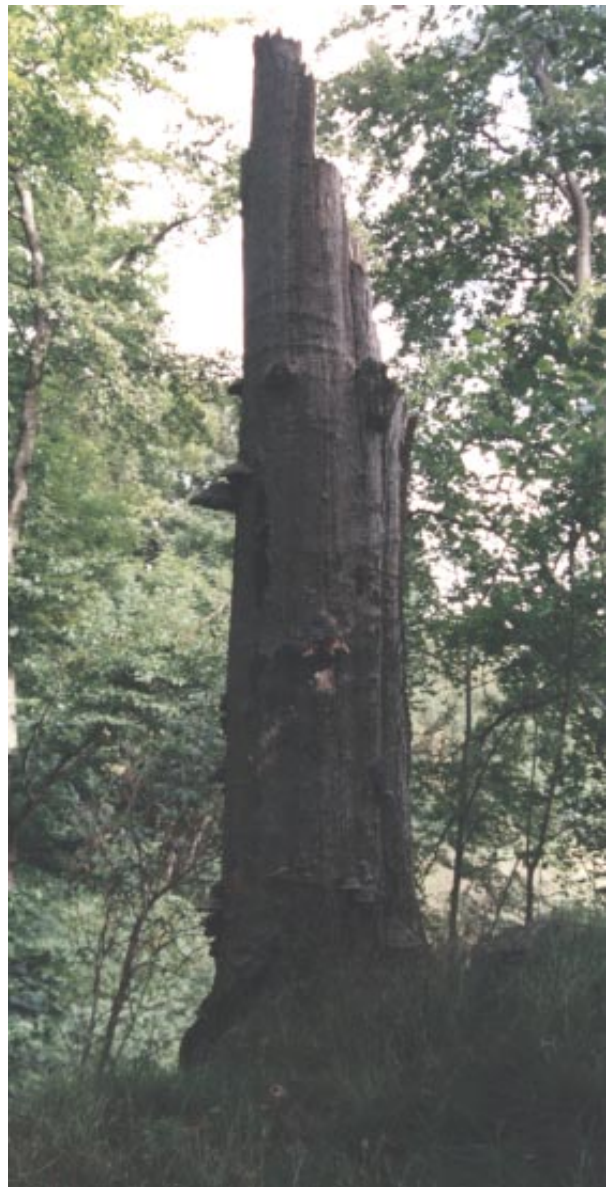
Gammelskogens torraka har betydelse för en myllrande mångfald.