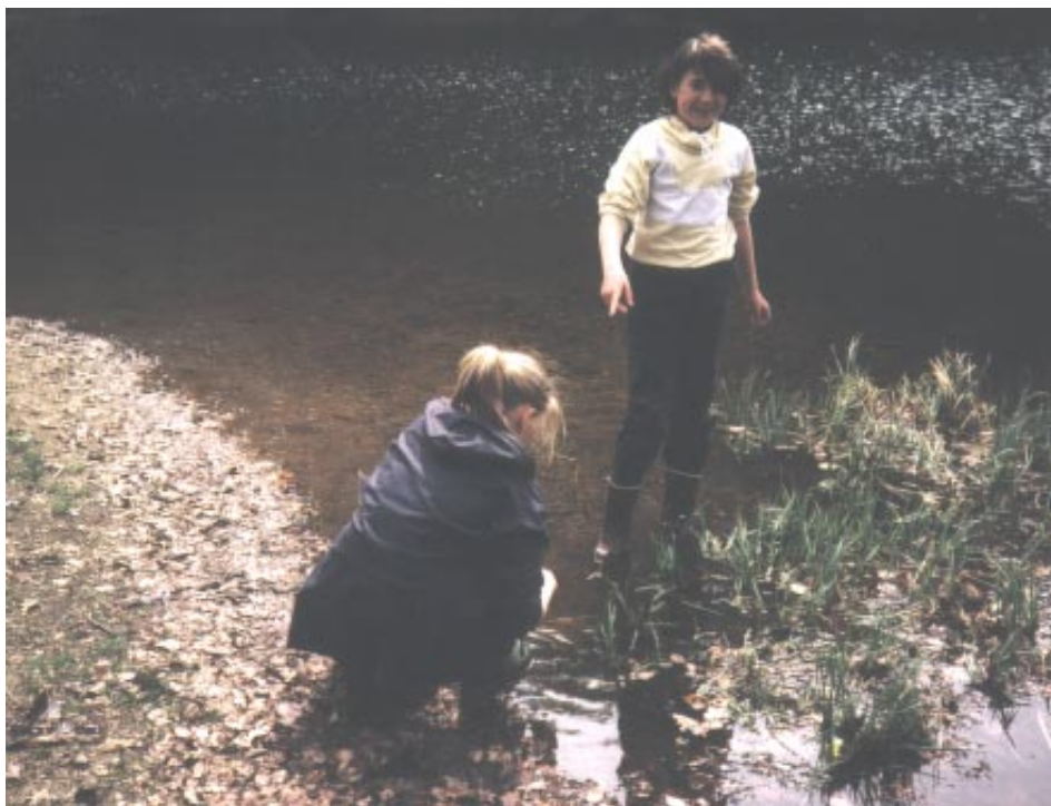
Vattenmiljön är en värdefull levande lärobok

Vattenskyddsområde kap 7 § 21-22. Vattenskyddsområde finns runt Klippans och Åstorps kommuners vattentäkter på Kvidingefältet.