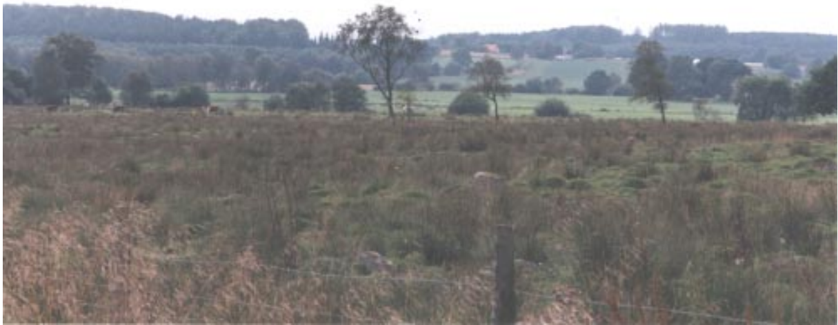
Fuktängar runt Konga ö