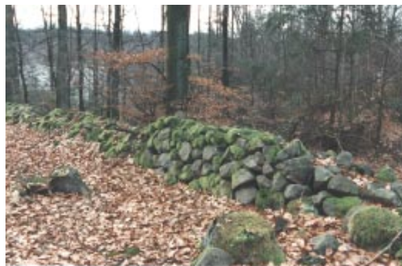
Stenmur från platån