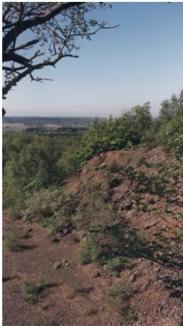
Utsikt från stenbrottet i Båv mot slätten väster om Söderåsen