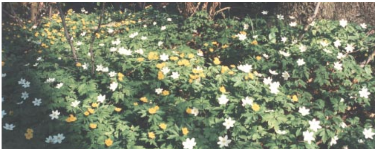
I den näringsrika lövskogen täcks marken på våren av vitsippa och gulsippa

Det måste skapas spridningskorridorer för arter mellan värdefulla naturområden. Små skyddade naturområden måste kompletteras med en buffertzona. Turismen måste kanaliseras. Naturbetesmarker måste ha en tillräcklig hävd. Fler naturområden på åsen måste få ett lagligt skydd. Kunskap måste spridas om naturvärdena på åsen till både brukare och besökare. Det är också viktigt att olika ansvarsmyndigheter, kommuner, markägare, olika intresseorganisationer och boende samarbetar kring utvecklingen av ett ekologiskt hållbart Söderåsen.