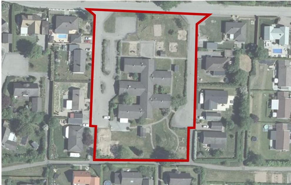
Området som omfattas av förslag till ny detaljplan

Detaljplanen handläggs med standardförfarandeenligt plan- och bygglagen SFS 2010:900.