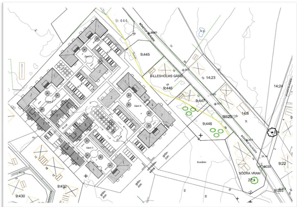
Bild nr 1 av Byggkoncept Syds illustration över tänkt placering av bostäder i Alberts schaktet.

Infarten till det nya bostadsområdet planeras att ske från Böketoftavägen söder om området. För att möjliggöra förslaget byggnation behövs även detaljplanerna som rör fastigheterna Billesholms gård 9:325, Billesholms gård 9:453, Billesholms gård 9:448 och Billesholms gård 9:452 ändras (se området bild nr 2).