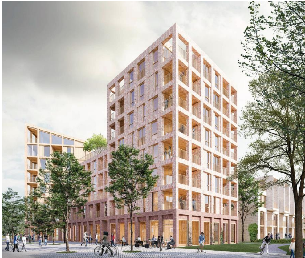
Planerad bebyggelse sett från huvudgatan/torget.