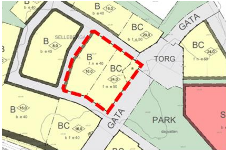
Aktuell tomt markerad