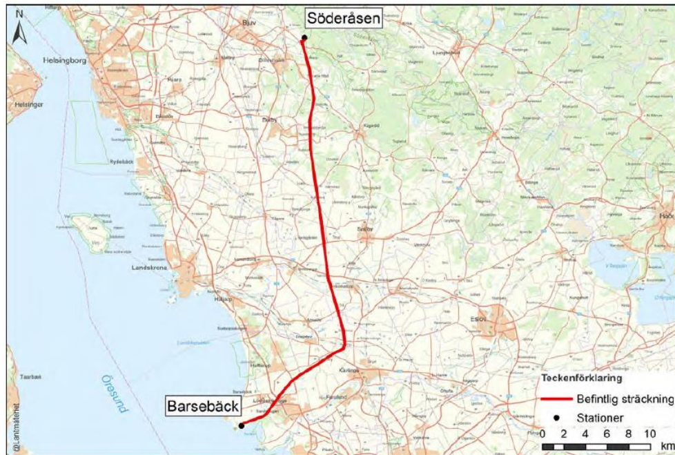
Figur 1 ovan, ett skärmutklipp från bilaga 6 i remitterat material, visar nätkoncession för linje mellan Söderåsen-Barsebäck.